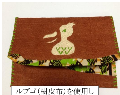
ルブゴ(樹皮布)を使用したカードケース

商品開発においては、樹皮布や瓢箪等、ウガンダ共和国ならではのユニークな材料を使用し、野生動物の楽園のイメージを生かした作品を展開しています。