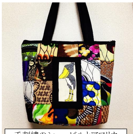
手刺繍のシュービルとアフリカン・プリントのトートバッグ