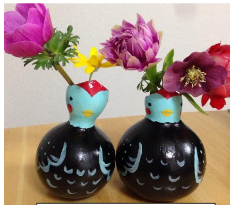
瓢箪ホロホロチョウ花器

活動を持続可能にする為に、収益の確保は必要です。ナントゴ・プロジェクトの商品売上は小規模ながら過去三年間増加を続け、今年度は、前年度比、1.4倍の増加となりました。継続してイベントに出展することで認知度がアップし、売上が増加したこと、新作品の開発努力の結果と考えられます。